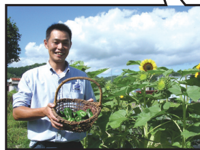
栽培システムハウス