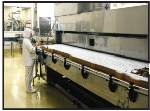
食品製造冷熱冷却システム