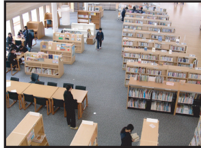
エコスクール冷暖房システム