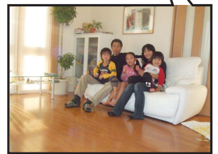
個人住宅冷暖房給湯システム